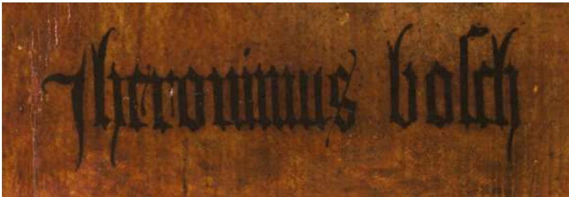
Figuur 1 De verzoeking van de Heilige Antonius (detail) – Jheronimus Bosch - Museu Nacional de Arte Antiga, Lissabon

Twee van de drie genoemde schilderijen tonen een signatuur die fraai is uitgewerkt en met name op het schilderij “De Verzoeking van de Heilige Antonius” (Museu Nacional de Arte Antiga, Lissabon) staat een prachtige handtekening die hier is afgebeeld: