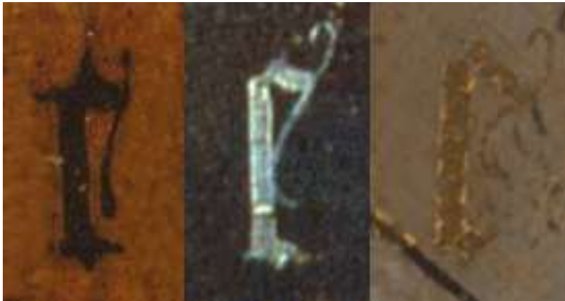
Figuur 6 v.l.n.r. Verzoeking Heilige Antonius, Tuin der Lusten, Ecce Homo (detail)

Daarentegen lijkt deze letter 'e' op die op de achterkant van de zijpanelen van "De Tuin der Lusten".