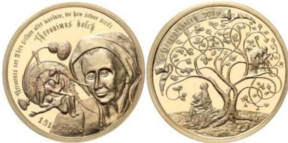
Figuur 4 Jheronimus Bosch 2016 herdenkingspenning - Lei Lennaerts

De Numismatische Kring Brabant is enkele jaren geleden een samenwerking aangegaan met het Jheronimus Bosch Art Center. Doel van deze samenwerking was een tentoonstelling over geld en de handel tijdens het leven van Bosch. Die tentoonstelling met als titel “Jeroen en het geld van toen” is gedurende het hele Jheronimus Bosch jaar te zien in het JBAC. Tevens werd er een commissie gevormd die zich boog over de ontwerpen voor een penning die in 2016, de vijfhonderdste sterfdag van Bosch, zou worden uitgegeven. Uit de samenwerking met de commissie ontstond een definitief ontwerp dat resulteerde in een penning van 45 mm.