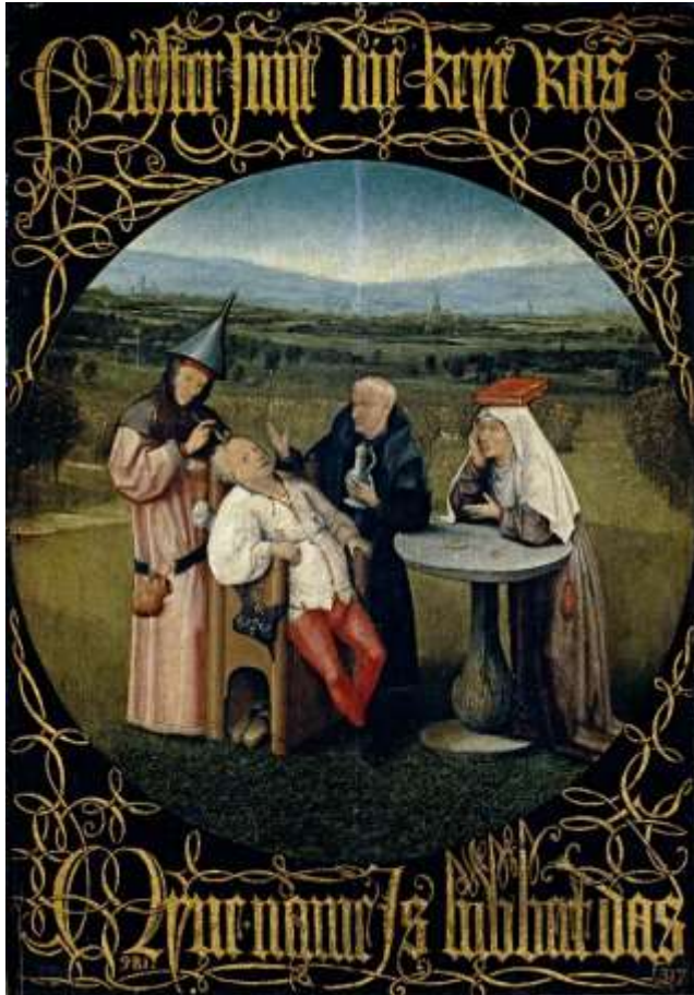
Figuur 3 De Keisnijding- Navolger van Bosch – Prado, Madrid

Een modern lettertype dat gebaseerd is op een gotische letter moet omwille van de leesbaarheid aangepast worden aan de huidige tijd. Men had in de tijd van Bosch de gewoonte om gotische letters vrijwel in elkaar te doen overlopen. Een mooi voorbeeld hiervan is te zien op het schilderij “De Keisnijding”, toegeschreven aan een onbekende navolger van Jheronimus Bosch. Het heeft prachtige gekalligrafeerde letters die de gemiddelde burger tegenwoordig echter slechts met grote moeite kan lezen. Het vergt enige oefening om de tekst “Meester snijdt die keye ras - Myne name is lubbert das” te kunnen ontcijferen. Voor de tijdgenoten van Bosch, mits die konden lezen, was dit geen probleem. Om zo’n letter voor de moderne mens leesbaar te maken, moeten er daarom ‘letterwit’ tussen staan. De kalligrafie op dit schilderij toont overeenkomsten met de letters van Bosch. De kalligrafie lijkt ook op teksten die op de wapenborden van het Kapittel van het Gulden Vlies uit 1481 voor komen.