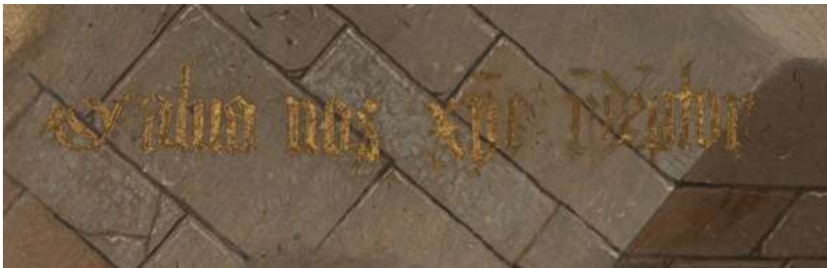
Figuur 5 Ecce Homo (detail) - Jheronimus Bosch - Städel Museum - Frankfurt .a.M.

In december 2015 stuurde prof. dr. Jos Koldewey mij een afbeelding in hoge resolutie van het schilderij “Ecce Homo” waarop in gouden letters in een tekst (zoals in een stripverhaal) een groot aantal gotische letters te zien zijn. Dit schilderij wordt door de experts aan Bosch toegeschreven en Jos Koldewey adviseerde mij om de letters op het paneel te bestuderen. Dat heb ik gedaan en ik constateerde dat de vorm van de stokken, de staarten en de uitlopers van de schreven grote overeenkomsten vertonen met letters op andere aan Bosch toegeschreven schilderijen.